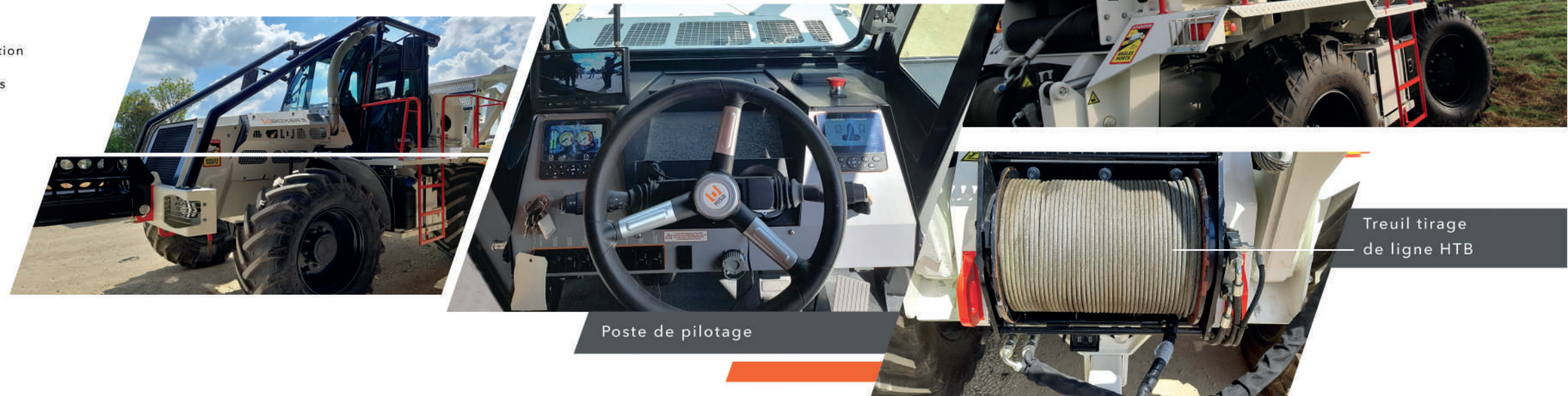
Treuil tirage de ligne HTB