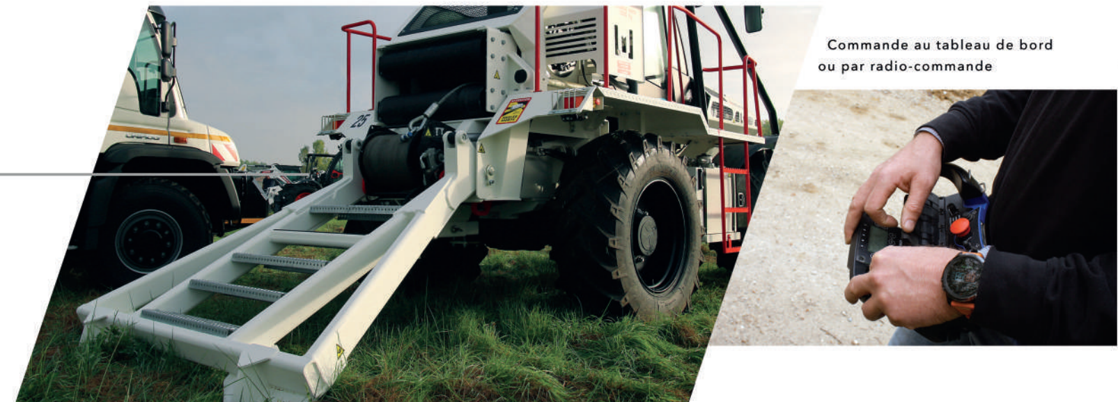
Commande au tableau de bord ou par radio-commande